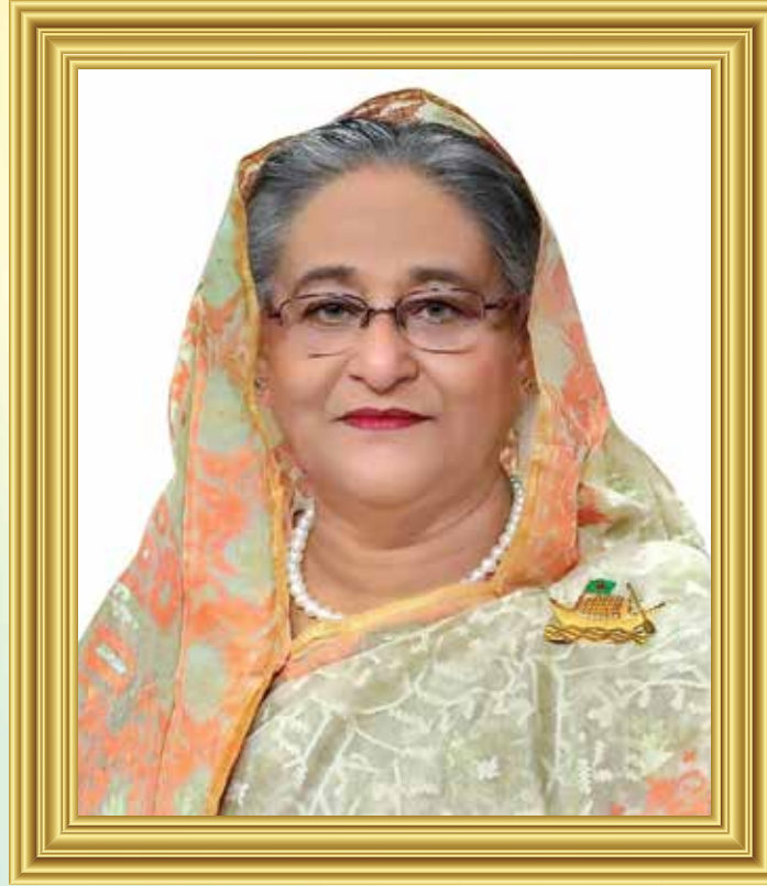
মাননীয় প্রধানমন্ত্রী শেখ হাসিনা